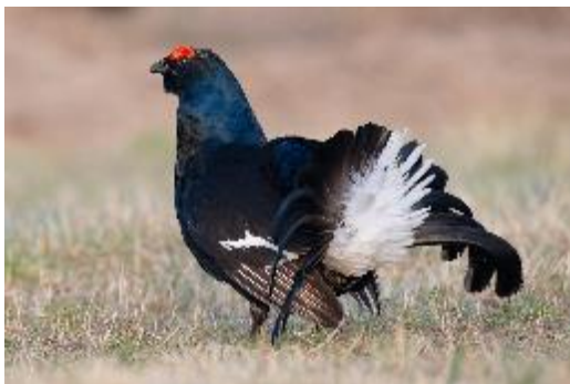
Birkhahn bei der Balz

Mit einfachen Verhaltensregeln können wir die faszinierenden Wildtiere schützen, damit sie sich weiterhin in den schönen Wäldern im Gurnigelgebiet zuhause fühlen.