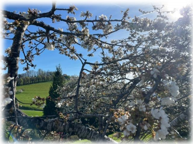
Abb. Frühling 2024, Weidligraben, Richtung Schloss Burgstein

Liebe Bürgerinnen und Bürger von Burgstein