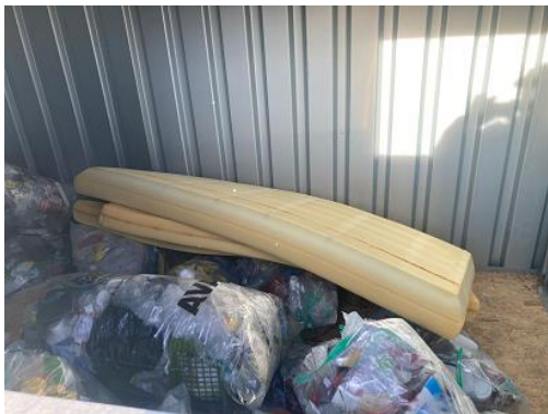
Illegale Entsorgung April 2024

Bitte beachten Sie, dass Sie für die Kunststoffsammlung die dafür vorgesehenen gebührenpflichtigen Säcke verwenden. Diese sind bei der Gemeindeverwaltung Burgistein oder auch beim Detailhändler wie Migros, Coop, Volg etc. in verschiedenen Grössen erhältlich. Sie kosten gleichviel wie die üblichen AVAG-Säcke für Haushaltkehricht.